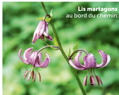
Les martagons au bord du chemin.