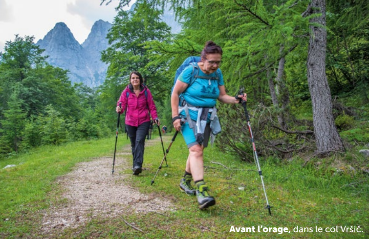
Avant l'orage, dans le col Vršič.

E n suspension au-dessus du col Vršič, des nuages menaçants recouvrent complètement les sommets hérissés des Alpes juliennes. A peine sommes-nous arrivés à la chapelle russe que la pluie se met à tomber. Sans attendre, nous sortons les vêtements de pluie de nos sacs à dos avant de poursuivre l'ascension. Petit à petit, l'air se rafraîchit et une légère brise se lève, facilitant la progression de la joyeuse troupe de randonneuses autrichiennes à laquelle je me suis joint. Puis, la couverture nuageuse se déchire d'un coup, dévoilant, dans la falaise, le visage émouvant d'une jeune fille en pleurs (ajdovska deklica). Sur un chemin bordé de lis martagons et d'ancolies en fleurs, nous atteignons, sous une pluie toujours plus soutenue, la cabane de Tičarjev, située au col à 1611 m d'altitude.