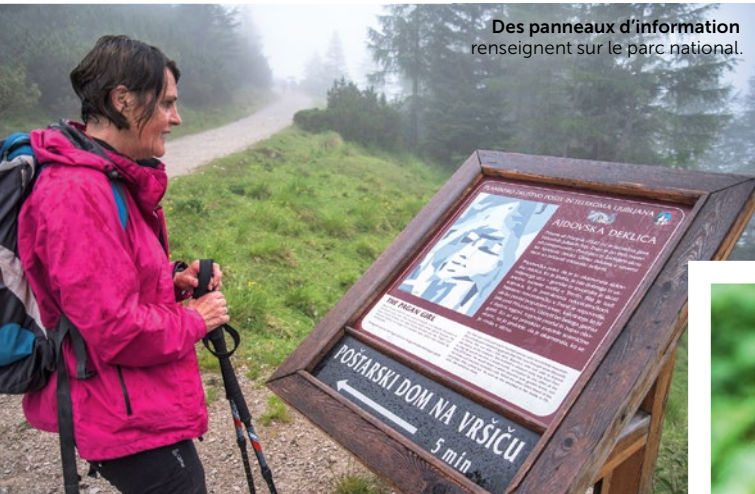
Des panneaux d'information renseignent sur le parc national.