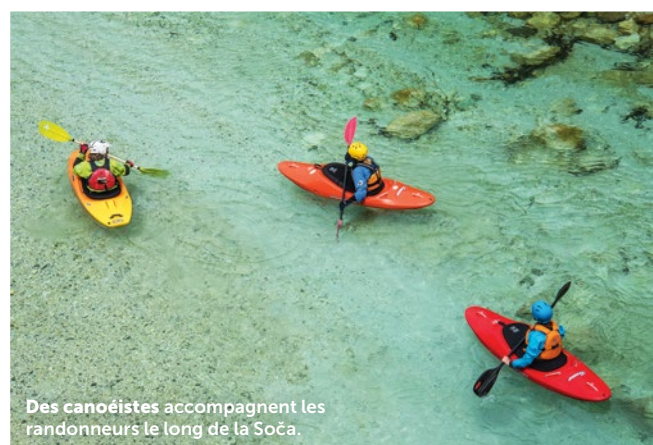
Des canoéistes accompagnent les randonneurs le long de la Soča.