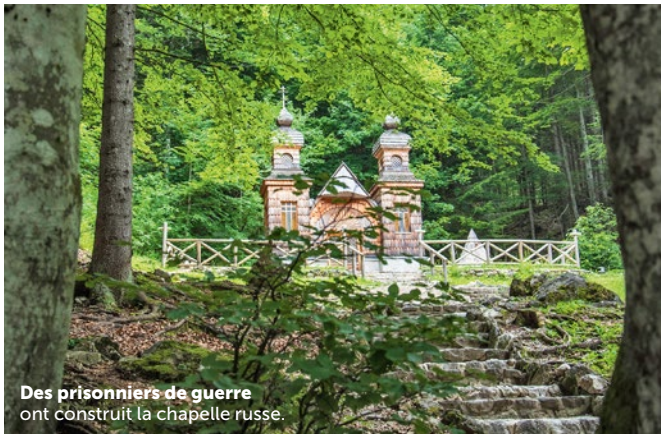
Des prisonniers de guerre ont construit la chapelle russe.