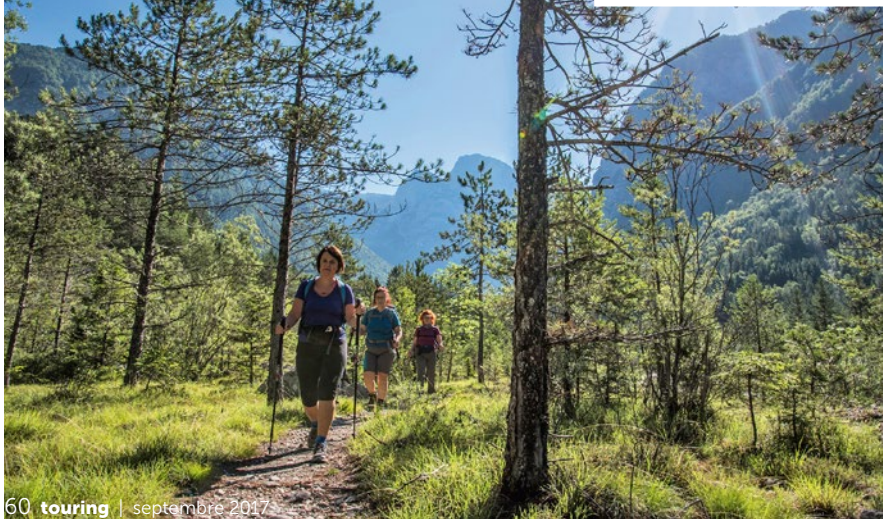
Les chemins de l'Alpe Adria Trail sont bien aménagés.