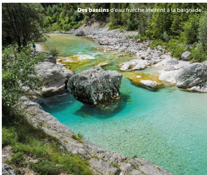
Des bassins d'eau fraîche invitent à la baignade.