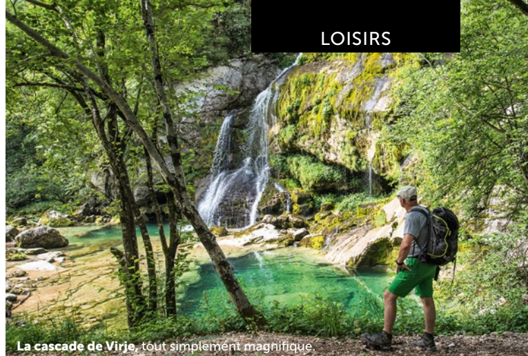
La cascade de Virje, tout simplement magnifique.

Des panneaux indiquent le chemin vers la prochaine étape.